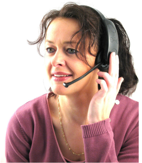
Bedienung der Sensortasten mit einem, zwei oder mehr Fingern.

Die Lautstärke im Ohrhörer kann durch die Plus/Minus Tasten (kleine Sensortasten in der Mitte) durch Festhalten der jeweiligen Taste in 9 Stufen eingestellt werden.