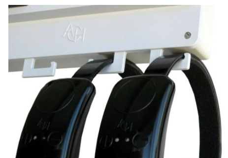
Lagerung der AIO Headset.

Das Headset kann zur Aufbewahrung an den unten am Ladegerät befindlichen Haken aufgehängt werden.