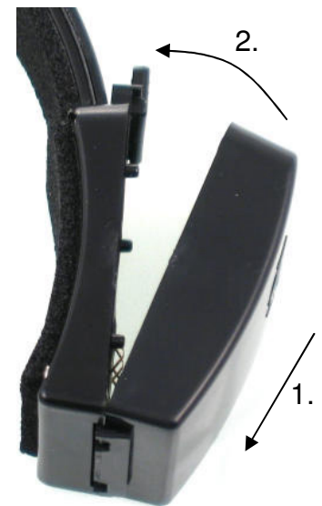
Einsetzen des Akkus

Vor dem Aufsetzen des All In One Headsets die richtige Größe am Bügel einstellen. Wichtig ist die richtige Positionierung des Mikrofonarms. Das Mikrofon sollte sich leicht unterhalb des Mundes befinden damit der Gast Sie optimal verstehen kann.